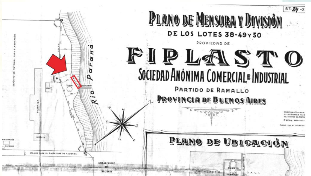
Figura 3. Plano contemporáneo al hallazgo del mastodonte donde se señala con un recuadro el sector de barrancas solicitado a la empresa para iniciar una breve prospección geológica y paleontológica.